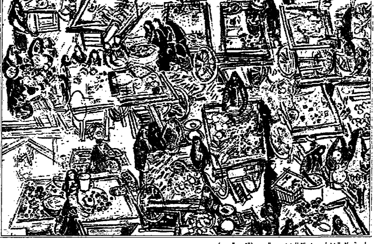
لوحة «منظور عين الصغور» من الأعمال الحديثة.

هذا الشارع الضيق الذي امامها أعلى اللوحة. ان الاشارة بخصر الحركة واجبة عند تأمل هذا العمل، تلك الاوان التي يفتح لها الافاق، عندما يعيون ويخبطون بالوان الفرح.